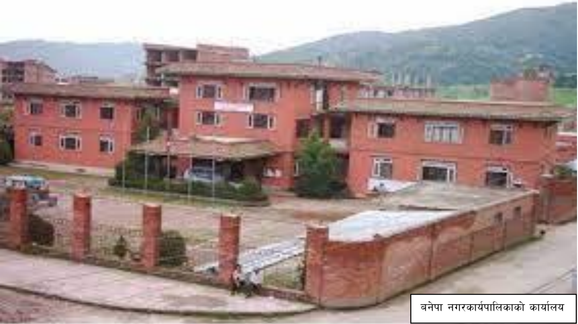
बनेपा नगरकार्यपालिकाको कार्यालय

बनेपा नगरपालिकाले पनि सर्वसाधारणको दैनिक जीवनसँग प्रत्यक्ष सरोकार रहेका सेवाहरु स्थानीय तहवाट वितरण गर्ने गर्दछ ।