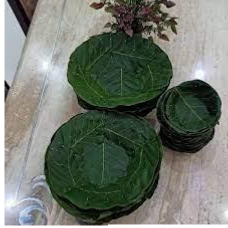
सालका पातको टपरी

बाँसको चोया काटेर डोको डालो बनाउने, पातवाट टपरी, दुना बनाउने र परम्परागत रूपमा गरिने अन्य यस्ता धेरै प्रकारका कार्यहरु हाम्रो घरायसी जीवनका अत्यन्त आवश्यक पर्ने वस्तुहरुको उत्पादन गर्नमा सहायक सिद्ध भइरहेका छन्। एक पुस्तावाट अर्को पुस्तामा परम्परागत रूपमा प्रविधि हस्तान्तरण हुने यसप्रकारका पेशाहरुमा विशेष तालिम परिश्रम लगानी गरेको नदेखिए तापनि यसको आफ्नै महत्व र औचित्य रहेको प्रष्टसँग बुझ्न सकिन्छ। यसप्रकारका उत्पादनले हाम्रो आवश्यकताहरु पूरा गरेका छन् भने अर्कोतिर हामीलाई आफ्नो आवश्यकतामा स्व:निर्भर हुनका लागि सहयोग गरेका छन्। जसले गर्दा हाम्रा घरायसी आवश्यकताहरु पूरा गर्नका लागि सधैं बजारकै मात्र मुख ताक्नु पर्ने अवस्था रहेको छैन। तथापि यसप्रकारका परम्परागत उद्यमशीलताका कार्यहरु बिस्तारै लोप हुँदै गएको पाइन्छ।