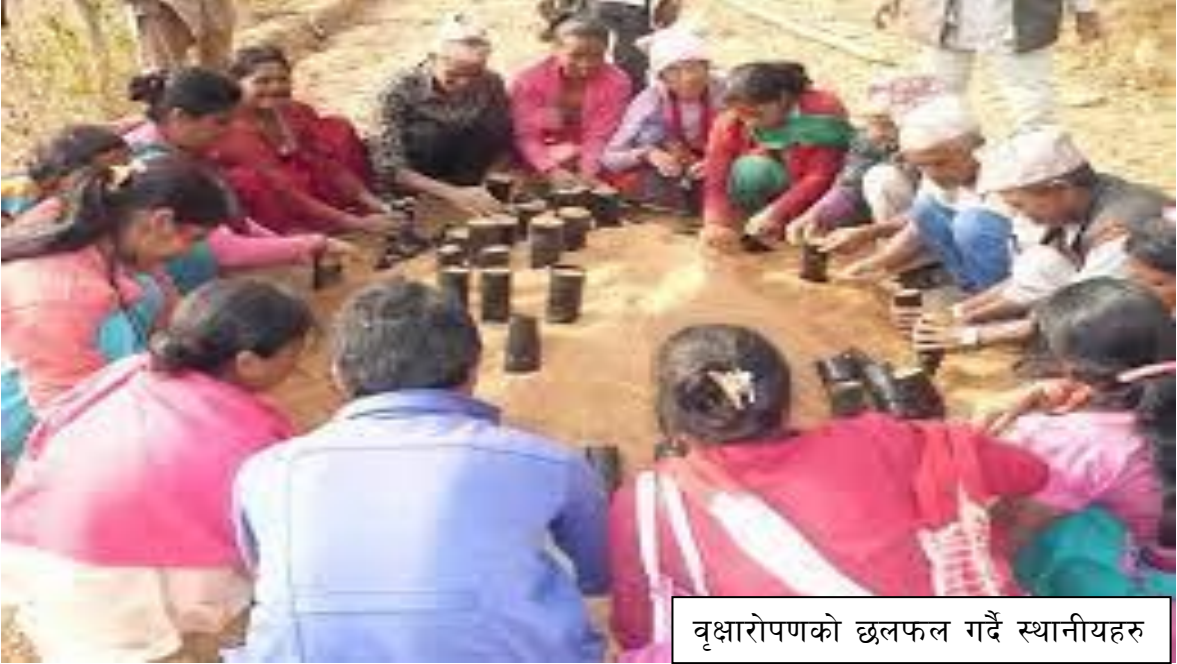
वृक्षारोपणको छलफल गर्दै स्थानीयहरू

प्राकृतिक श्रोतको व्यवस्थापनमा विद्यालय र समुदायस्तरमा समेत कार्यक्रमहरू सञ्चालन हुने गरेका छन् । विद्यालयमा प्राकृतिक श्रोतको संरक्षणका सन्दर्भमा पाठ्यपुस्तकमा अध्ययन गर्ने, करेसावारी र फूलवारीको निर्माण र संरक्षणमार्फत सानै उमेरदेखि वनस्पति संरक्षणप्रति बालबालिकालाई सजग बनाइन्छ । घर र समुदायमा करेसावारी र खेतीपातीका लागि स साना बुट्यानहरूको संरक्षण गर्ने कार्य गरिन्छ । त्यस्तै पानीको श्रोतहरूलाई ढुंगेधारा, पोखरी र अन्य जलाशयहरूमार्फत संरक्षण गर्ने गरिन्छ ।