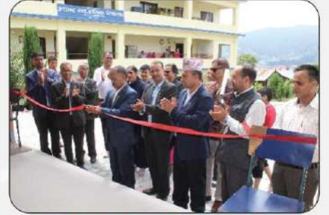
नगर स्तरीय विज्ञान विषयको शैक्षिक सामग्री प्रदर्शन २०८१