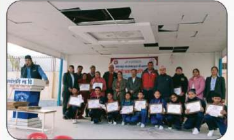
नगर स्तरीय हाजिरी जवाफ प्रतियोगिता २०८१