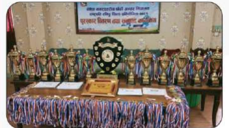
राष्ट्रपति रनिङ्ग शिल्ड प्रतियोगिता-२०८१ को पुरस्कार वितरण