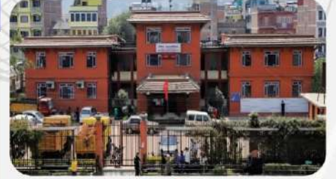
बनेपा नगरपालिका भवन

विनियोजित बजेटको कार्यान्वयन एकरूपता, कार्यविधिगत वैधता व्यवस्थापकीय चुस्तताले पारदर्शिताको प्रवर्द्धन गर्ने र पारदर्शिताका लागि सहभागितामूलक सहउत्पादन तथा सहनिर्माणमार्फत सुशासनलाई अनुभूतियोग्य बनाउन शैक्षिक बुलेटिन प्रकाशन गरिएको छ। बुलेटिनमा शिक्षा, युवा तथा खेलकूदसँग सम्बन्धित नीतिगत र संरचनागत अवस्थाको भ्रलक, बजेट विनियोजन र निकासको स्थिति खर्च गर्ने मापदण्डसमेत समावेश गरिएको छ। सम्पूर्ण शैक्षिक संस्था, शिक्षक कर्मचारीसमेतको विवरण समावेश गरिएको आधिकारिक दस्तावेजले आगामी दिनका लागि सरोकारवालाहरूको भरोसायोग्य सूचनाको स्रोत हुनेछ भन्ने विश्वास लिएका छौं।