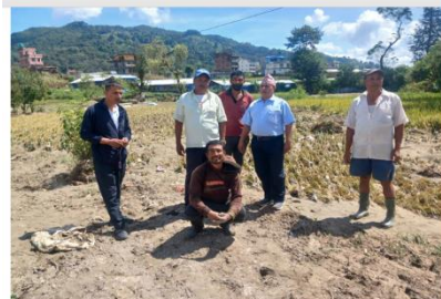
बाढी पहिरोबाट भएको क्षतिको अनुगमन बनेपा १-४ का केही झलकहरू