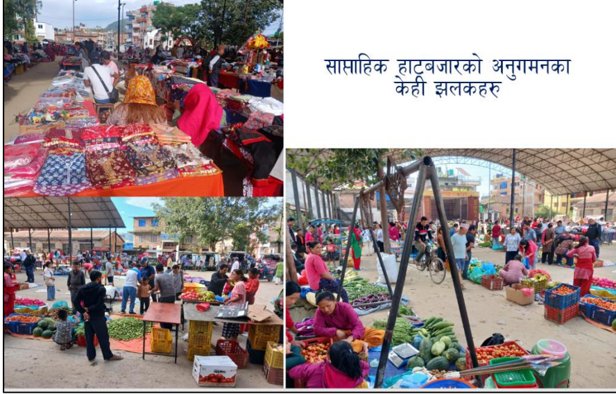
साप्ताहिक हाटबजारको अनुगमनका केही झलकहरू