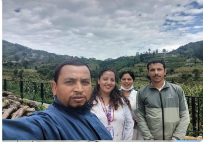
शाखाबाट नियमित फिल्ड अनुगमन बनेपा १-४ र ९ केही झलकहरू